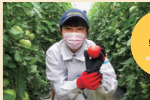
園芸科学科 野菜類型 Vegetables