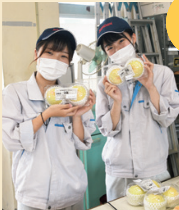
園芸科学科 果樹類型 Fruits